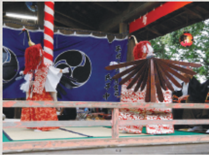
【遠江森町の舞楽】 国指定重要無形民俗文化財

浪曲でおなじみ、森の石松で知られる大洞院は、全国3,400余の末寺を持つ名刹。「消えずの灯明」、「結界の砂」など怨仲禪師にまつわる数々の伝説があり、「伝説の寺」とも呼ばれています。