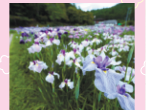
【花菖蒲一小國神社】

蓮華寺は萩で知られています。初夏から秋にかけてさまざまな萩が境内に咲き誇ります。見頃6月から9月まで。