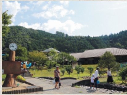
【森町体験の里 アクティ森】

1450年の永い歴史を持ち、老杉繁る参道や境内は、まさに「古代の森」の名にふさわしい荘厳な雰囲気。初詣には、町内はもとより各地から多くの人で賑わいます。