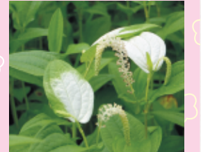
【半夏生一鍛冶島地区】

ハンゲショウは、花の時期に葉の一部が白く染まるという不思議な特徴を持ったドクダミ科の植物です。見頃6月中旬から7月下旬まで。