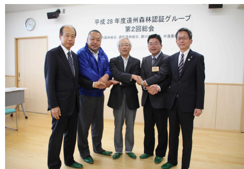
写真 広域連携で森林認証 管理団体を発足 「遠州森林認証グループ」