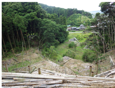
写真 森の力再生事業により 機能回復した森林