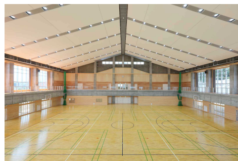
写真 森町総合体育館

さらに、町内の森林で生産された木材を使った木工教室や、町内で生産されたしいたけ等の林産物を出品する物産展等を開催する。