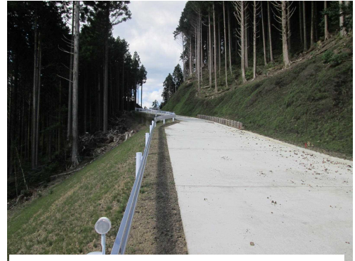
写真 森林基幹道大尾大日山線