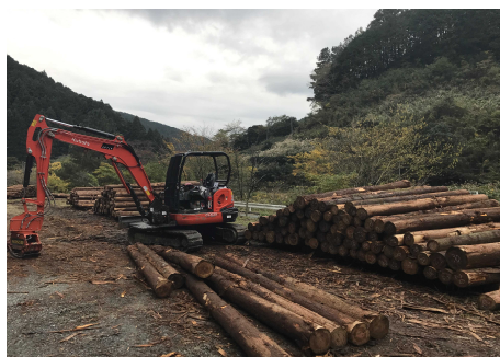
写真 亀久保山土場