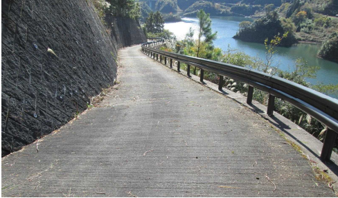
写真 林道片吹東線

ここでは、森林施業を低コストで効率的に行うために必要な作業路網の整備に関する事項を示す。作業路網については表4-1に定義する。