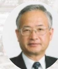
静岡県森町長 村松 藤雄

悠久の古来より人々に豊かな恵みを与えてきた自然と、 秋葉街道の宿場町として栄えた伝統文化が息づくまち。 そんな森町には人と自然が一体となって織りなす ほうじゅん 豊潤でゆったりとした時の流れがあります。