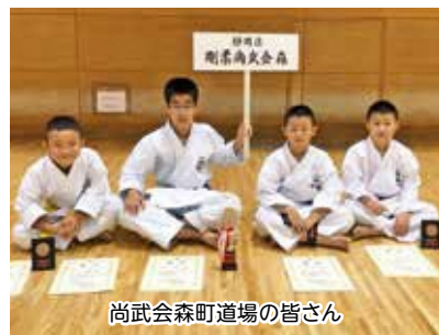
尚武会森町道場の皆さん