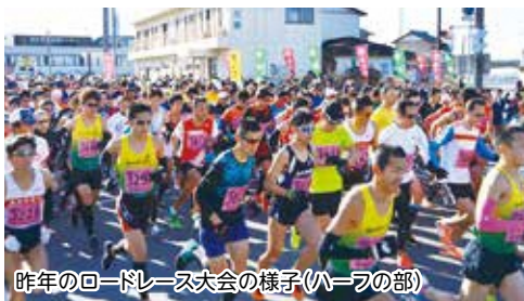
昨年のロードレース大会の様子(ハーフの部)