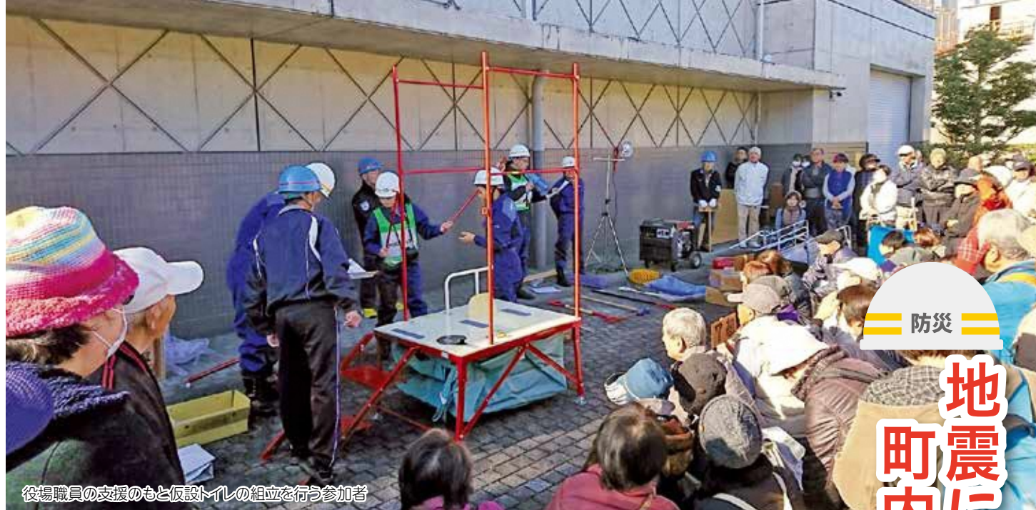
役場職員の支援のもと仮設トイレの組立を行う参加者

「地域防災訓練の日」の12月1日、東南海沖を震源とする大規模地震の発生を想定した地域防災訓練が町内各地で行われました。訓練では、東日本大震災の教訓を踏まえて、地域内の危険箇所の確認や家具の固定など、家庭内の安全確認や地震発生時の地域での行動などを再確認しました。