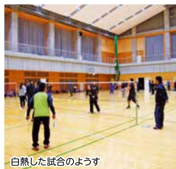
白熱した試合のようす

森町総合体育館で12月8日、「第13回しずおかスポーツフェスティバル兼第3回森町ファミリーバドミントンかわせみ大会」が開催されました。ファミリーバドミントンは3人制で誰もが気軽に楽しめるスポーツとして人気があり、県西部地区から多くのチームが参加しました。