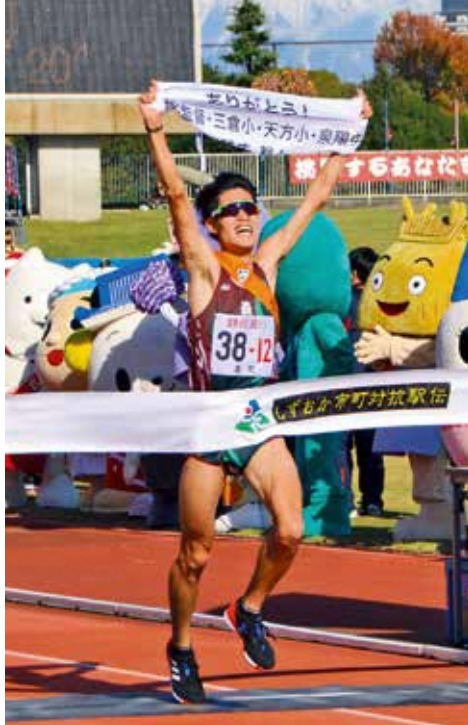
▲感謝の気持ちを掲げゴールする12区・三郷選手