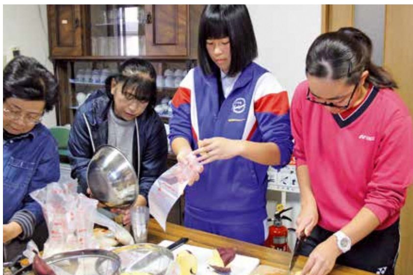
▲中学生が参加した非常食の調理(草ヶ谷)