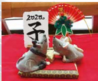
アクティ森で製作された干支の置物

人口減少対策、地方創生推進では、情報発信と移住定住・関係人口・交流人口の拡大に力を入れて取り組んでまいりました。7月に新たな魅力創出発信プロジェクトとして、アクティ森での「ロールプレイングトリップinモリマチ」をスタートさせました。10月には首都圏在住の森町ゆかりの方を招いて「森町ふるさと交流会」を開催し、町の取り組みの紹介や懇親で交流を深めました。今後、ふるさと森町を応援していただくネットワークをさらに広げていきます。その他、東京都江東区で開催された江東区民まつ