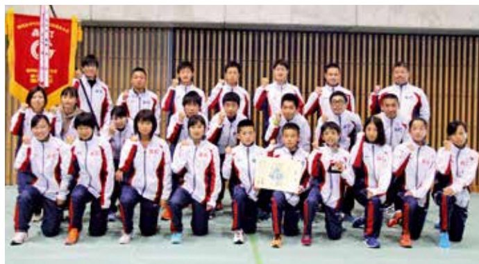
▲6位入賞を勝ち取った森町チーム