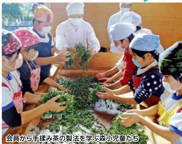
会員から手揉み茶の製法を学ぶ森小児童たち

森小で12月3日、周智茶手揉み保存会の指導のもと、3年生67人が「お茶の手揉みとお茶の淹れ方」を学びました。手揉み体験では、児童たちが両手で茶葉を振る「落とす」「葉振るい」や、両手で茶をころがす「回転もみ」など伝統の技を体験。お茶の淹れ方では、湯の温度により、旨みと渋みが違うことを学び、児童たちからは「苦いけど、すごくおいしかった」などの感想が聞かれました。