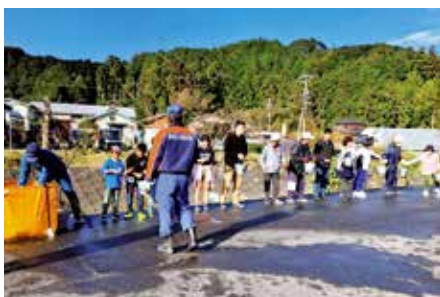
▲多くの人が参加したバケツリレー(宮代)