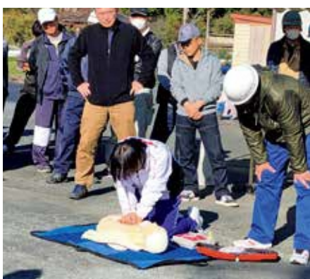
▲AEDを使用した救命処置(宮代)

草ヶ谷町内会では、ハイゼックスを使用した非常食（さつまいも）とリンゴのコンポート、だししょうゆご飯の作り方を自主防災会から教わり、試食を行いました。