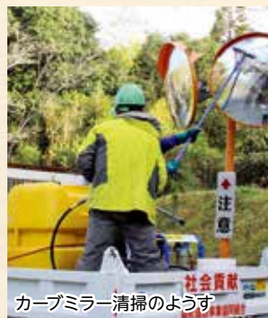
カーブミラー清掃のようす

森町建設事業協同組合（岡野良隆会長）は11月15日、町内のカーブミラー清掃を行いました。清掃には、同組合6社から20人が参加。県道や町道に設置されている301基のカーブミラーの鏡や支柱を、洗剤やモップを使いきれいに磨き上げました。