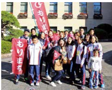
▲熱い声援を送る応援団のみなさん