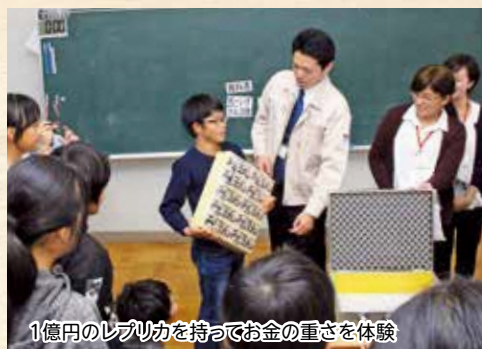
1億円のレプリカを持ってお金の重さを体験

宮園小6年生児童56人は11月14日、社会科で「税」について学びました。役場税務課職員が講師となり、「税金って何?」「税金って何で必要なんだろう?」「税金を納めたことのある人はいる?」などと児童らに質問を投げかけながら、税金の使いみちや税金の流れについて学びました。税金のない世界を描いたアニメを見た児童たちは、「税金がないとみんなが大変な暮らしになってしまつ」「学校での授業料や教科書代を払わなくてはならない」などの感想が聞かれました。