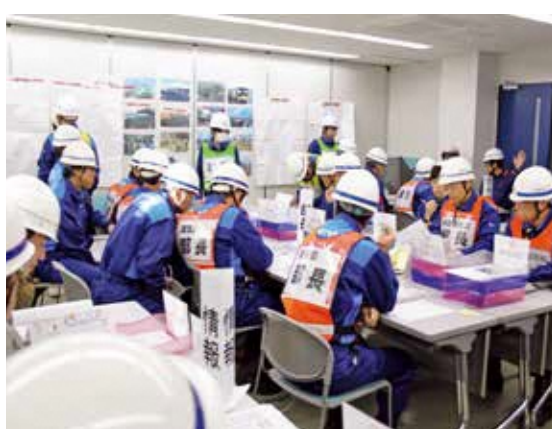
▲災害対策本部で行われた情報伝達訓練のようす(森分署内)

宮代西・東町内会では、避難所の運営と災害への備えについて、ハザードマップ、ガイドブック等を活用して確認を行いました。参加された皆さんは、住んでいる地域の危険箇所の把握、その対応などについて学びました。