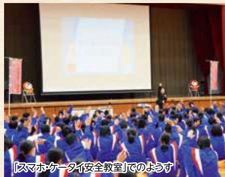
「スマホケータイ安全教室」でのようす

携帯電話やインターネットの正しい利用方法や危険性について学ぶため、袋井人権擁護委員協議会と携帯電話会社（NTTドコモ）が連携した人権教室が、12月11日、旭が丘中学校の全校生徒を対象に開催されました。「スマホ・ケータイ安全教室」では、生徒たちは、映像やクイズを通して人権の大切さやSNSで気をつけたいことなどを学びました。NTTドコモ講師からは「投稿する際に個人を特定するヒントになるものがないか確認しよう」「書き込みには責任をもちましょ」と生徒たち呼び掛けをしました。