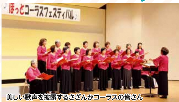
美しい歌声を披露するさざんかコーラスの皆さん

磐田・袋井・森町の文化協会による「ほっとコーラスフェスティバル」が12月14日、文化会館で開催され、各協会に加盟する合唱団体が美しいハーモニーを披露しました。