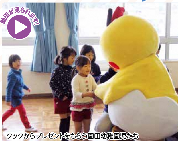
クックからプレゼントをもらう園田幼稚園児たち

年末の交通安全県民運動にちなみ12月16日、豊田合成(株)森町工場の社員と袋井警察署の交通安全指導員らが園田幼稚園を訪れ、交通安全を呼び掛ける「愛のクリスマス作戦」を行いました。トヨタグループのキャラクター「クック」の登場に大喜びした園児たちは、クイズや紙芝居で楽しく交通ルールを学び、交通安全のお約束をしました。19日には摩耶保育園で同様の交通安全教室を開催しました。