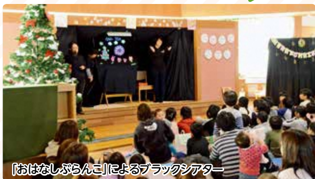
「おはなしぶらんこ」によるブラックシアター

児童館で12月14日、クリスマス会が開かれ、地元の小・中学生や高校生、「おはなしぶらんこ」のメンバーたちが歌やダンスなど楽しいステージを披露しました。