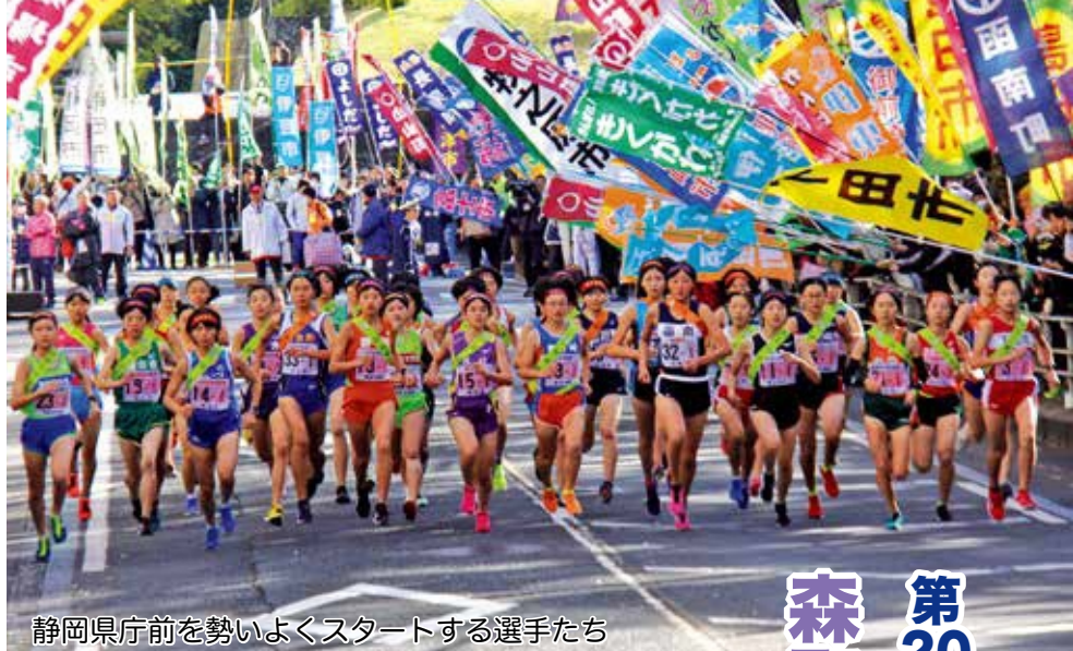
静岡県庁前を勢いよくスタートする選手たち