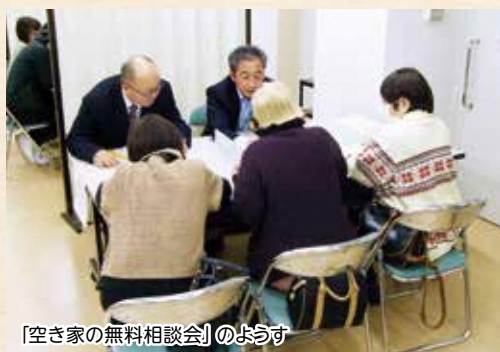
「空き家の無料相談会」のようす

県が主催する「空き家の無料相談会」が12月7日、町民生活センターで開催され、21組の方が参加しました。「相続した空き家を売却したいけど、何をすればいいのかわからない」など、様々な相談が寄せられ、専門家や職員が応じました。