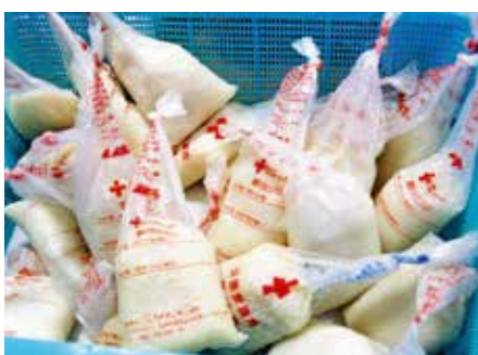
▲できあがった「だししょうゆご飯」(草ヶ谷)

宮代西・東町内会では、避難所の運営と災害への備えについて、ハザードマップ、ガイドブック等を活用して確認を行いました。参加された皆さんは、住んでいる地域の危険箇所の把握、その対応などについて学びました。