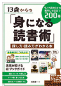
13歳からの 「身になる読書術」 大野雄一著・メイツ出版

問 森町立図書館 ☎85-1113 (9:00~17:00 水曜のみ19:00まで月曜休館)