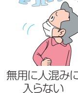
無用 に人混み に入らない