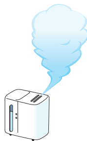
部屋の 適度な湿度

インフルエンザは、主に、咳やくしゃみの際に口から発生する小さな水滴（飛沫）によって感染します（飛沫感染）。普段から“咳エチケット”（①他の人に向けて咳やくしゃみをしない、②咳やくしゃみが出るときはマスクをする、③手のひらで咳やくしゃみを受け止めたら手を洗うことなど）を心がけてください。