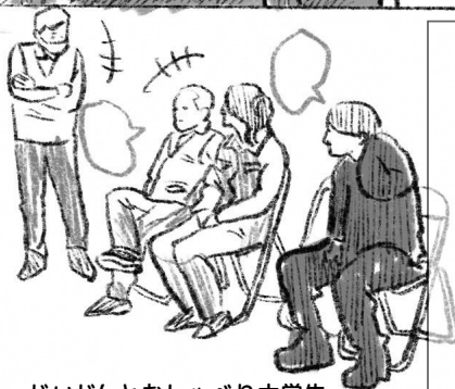
じいじ'sとおしゃべり大学生