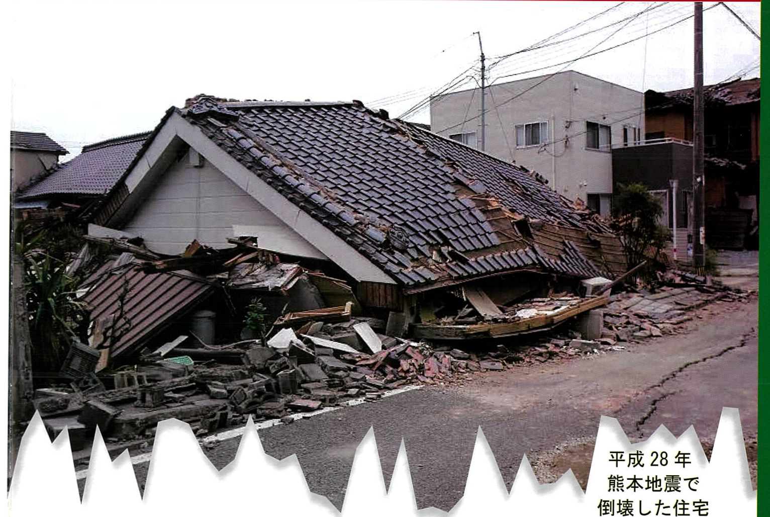
平成28年 熊本地震で 倒壊した住宅