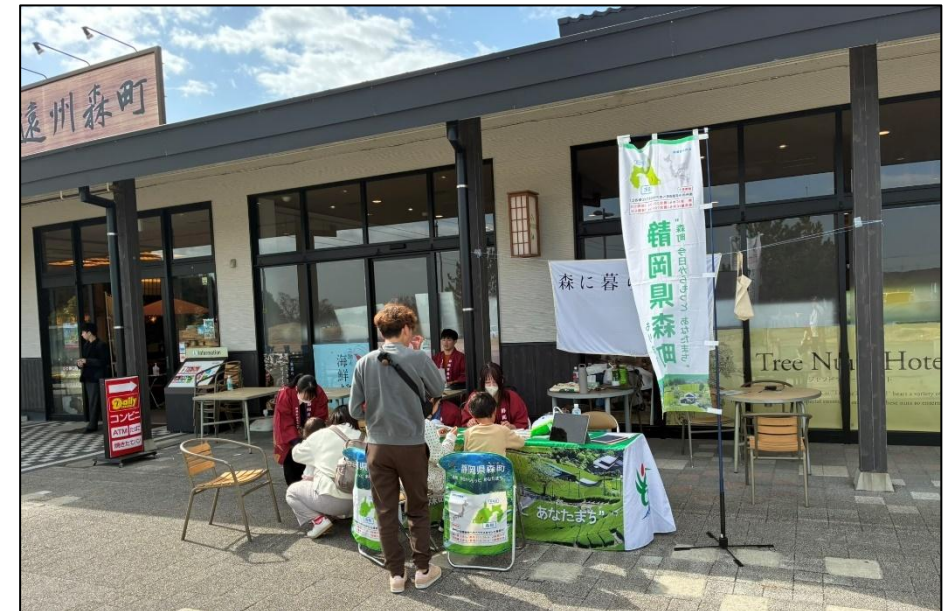
▲遠州森町PAでのアンケート調査の様子