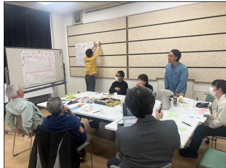
▲キーマン会議の様子