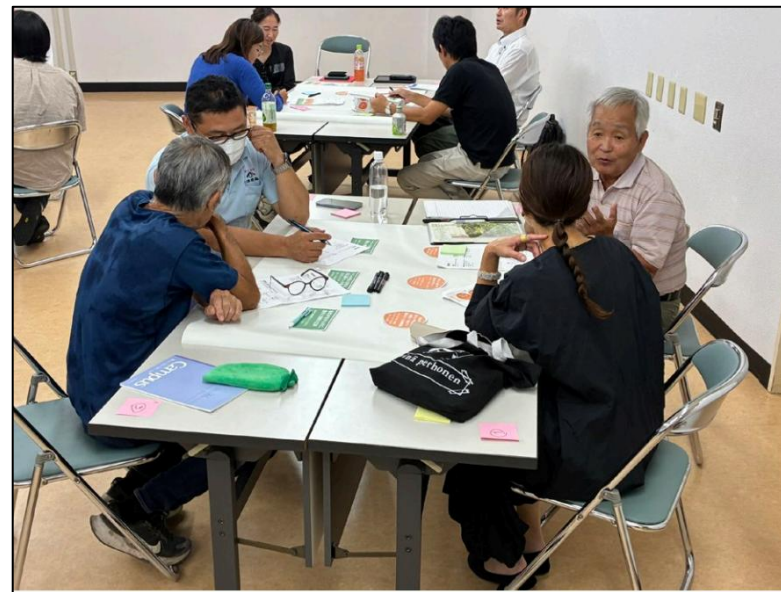
▲インタビュー調査結果を踏まえたワークショップの様子