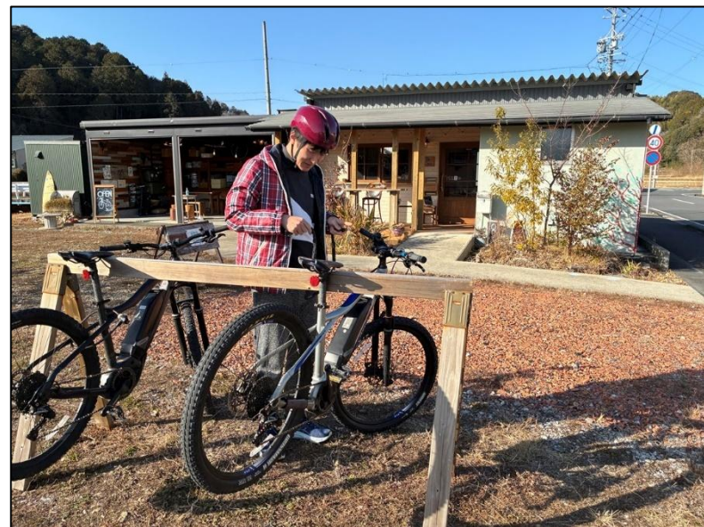
▲e-Bikeを活用した地域周遊の様子