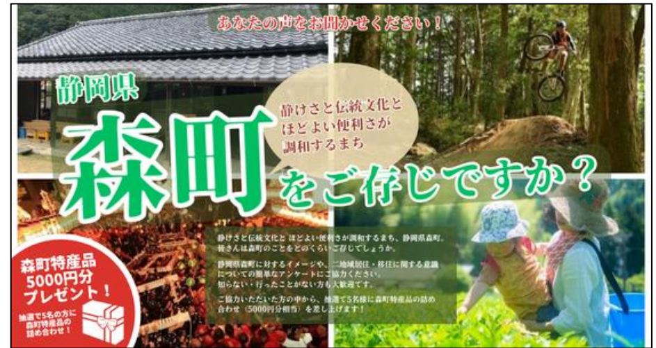
▲都市部マンションコミュニティ向けアンケート告知画像