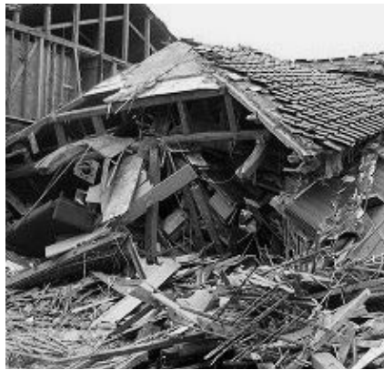
地震により倒壊した家屋

町長 燃料タンクが満タンで、 連続30時間 の運転が可能である。燃料の補給は、民間事業所との協定で確保を図る。