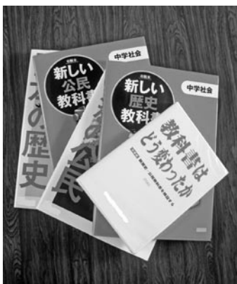
検定に合格した教科書の一部

教育長 教科書の展示会場で感想を記入してもらっている。また、採択案を決定する機関に保護者代表を含めている。