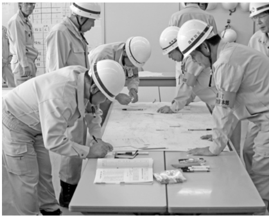
町の総合防災訓練(災害対策本部の様子)

町長 阪神大震災では、消防団が状況把握に大きく寄与した。消防団・職員から災害対策本部に情報を伝達するルートは大事だと思う。