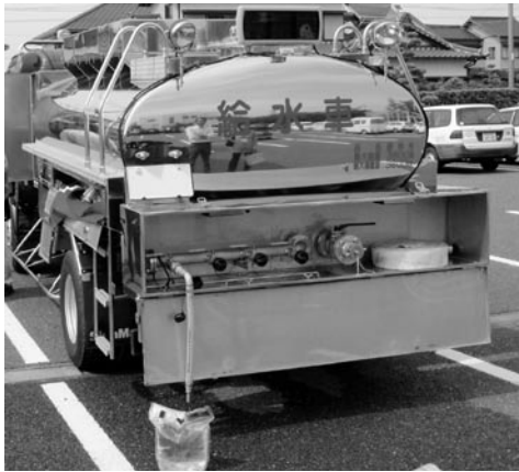
給水車 ※実際に購入するものとは異なります。

一般会計は、歳入歳出に1億1,223万3千円を追加し、23年度予算は65億2,733万9千円となりました。