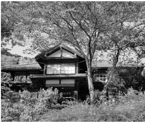
まちづくりに活かしたい文化財

文化の素材を町づくりに活かす事業は、ワークショップ等で検討可能である。都市計画街路の整備を行うにつ、町中にある歴史文化遺産も活用しながら、どのような町づくりをするかは、歴史文化基本構想の考え方を1つのベースとした取り組みが重要である。