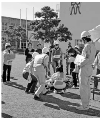
森小での避難所・救護所訓練の様子

町長 現状の備品に加え、各避難所に5台ずつ簡易トイレを配備する。また、給水タンク車を購入する。庁内の防災会議で必要な備品の洗い出しを行うとともに、太陽光発電機、携帯電話、給水用容器等の配備を検討する。