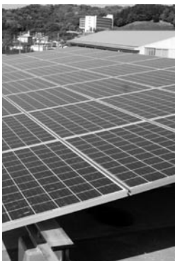
役場庁舎屋上に設置された太陽光パネル

町長 労働時間短縮の観点からも時間外勤務の縮減を進めたい。毎週水曜日をノー残業デーとして定時退庁を行っている。時間外勤務を残業とするか早朝出勤とするかは、職員の自主性に任せたい。